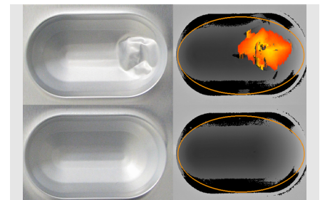
Foto und Auswertung eines Napfs