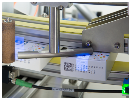
Hohe Positioniergenauigkeit der Etiketten durch präzise Faltschachtelführung

Die komplette Bedienung von vorne ist möglich - der Bediener ist nie gezwungen, umständlich um die Maschine herum zu laufen. Die Etikettierposition auf der Faltschachtel ist variabel und kann elektronisch verschoben werden.